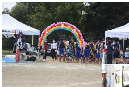
入場門、上手にできました