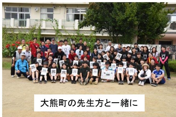
大熊町の先生方と一緒に

前日には、大熊町の方々、学校のある河東地区の方々、幼小中学校の先生方、ボランティアの学生が一同に集まって、お天気祭が行われました。当日はその成果があって、運動会日和になりました。運動会は、県内各地にいらっしゃる大熊町の多くの方々、転校していった児童・生徒、地域の方々、そして宮教生も参加し、在校生と共に一緒になって「顔晴ろう！大熊っ子！大会」を楽しみました。